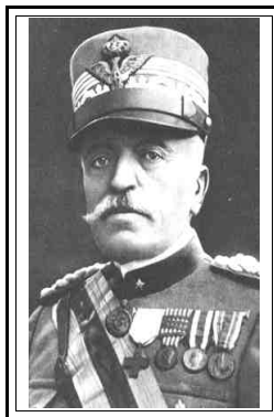
Il generale Luigi Cadorna

Tutti i reparti italiani in Palestina ed Egitto, dislocati a Porto Said, Giaffa e Sarona, verranno fatti rientrare in patria nell'agosto del 1919, mentre un ultimo distaccamento dei carabinieri di stanza a Gerusalemme rimarrà a proteggere la nostra delegazione consolare fino al 1° marzo 1921.