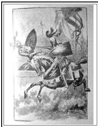
Illustrazione popolare ottocentesca della celebre disfida