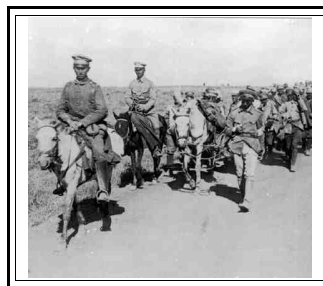
Prigionieri tedeschi in Palestina nel 1918

Questo breve resoconto, che si basa su materiale estratto dall'Archivio Storico dell'Esercito Italiano, dalle Memorie del Generale inglese Edmund H. Allenby e dalla ricerca dello storico Sergio Pelagalli (Italiani in Palestina), ha come scopo quello di coprire, almeno in parte, questa grave lacuna.