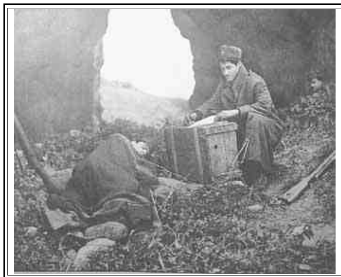
Fanti della Divisione Italia in un momento di pausa tra le montagne della Jugoslavia.

(Questa divisione combattè contro i tedeschi scarsamente aiutata dai partigiani forse perché non si inserì nelle forze armate di Tito come la Garibaldi. Di essa, come della Cremona, che non si arrese ai tedeschi alle Bocche di Cattaro o della Perugia che si aprì col sangue la via al mare attraversando l'Albania si parlò sempre molto poco. - N.D.R.)