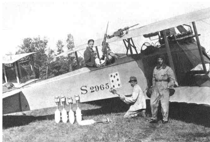
Ricognitore SAM I

Il nuovo Comandante in capo dell'Armata britannica, dopo avere passato in rassegna tutte le sue truppe, compresi i 450 soldati italiani del maggiore D'Agostino, iniziò subito a preparare una nuova grande offensiva con l'obiettivo di sfondare entro l'autunno la linea turco-tedesca Gaza-Bersheeba e poi marciare alla volta di Gerusalemme. E a favore del piano di Allenby - che nel frattempo riceve due nuove divisioni britanniche, migliaia di cavalli e muli e circa 300 pezzi d'artiglieria - giocheranno gli attriti tra tedeschi e turchi sul come impostare l'imminente campagna (il generale von Falkenhayn, che fa visita a Damasco per consultazioni con il Comando turco, vorrebbe scatenare una controffensiva in Mesopotamia per riconquistare Bagdad, occupata dagli inglesi l'11 marzo del '17, ma il generale Jemal Pasha si oppone definendo indispensabile la difesa ad oltranza della Palestina, per evitare la caduta della città santa di Gerusalemme e l'isolamento della numerosa armata turca arroccata a Medina, nell'Hegiaz).