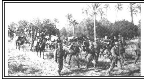
Truppe italiane in Sinai nel 1917