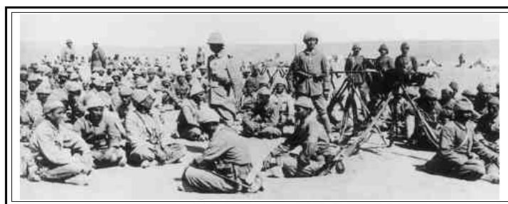
Fanteria Turca a Bersheeva nel 1917

Il Corpo italiano viene aggregato alla forza mobile del generale Watson (un grosso contingente misto che comprende la 20ma Brigata di fanteria indiana, una Brigata di cavalleria indiana e un distaccamento a cavallo di fucilieri francesi) al quale Allenby ha affidato il compito di presidiare un tratto di fronte presso Gaza. Nel frattempo un piccolo distaccamento di carabinieri viene lasciato a Rafa per sorvegliare la linea ferroviaria.