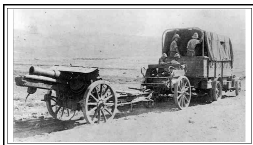
Pezzo da 150 mm. Tedesco catturato a Gaza nel 1917

di fanteria, uno dei quali marocchino, una batteria di obici someggiati da montagna da 75 millimetri e alcune dozzine di mitragliatrici Maxim), disponendo nel contempo di un vicino magazzino viveri e munizioni in muratura messo a disposizione dalla filiale egiziana del Banco di Roma. Il 4 giugno, il generale Archibald Murray andò a fare visita al contingente dei bersaglieri (i “soldati gallina”, come vennero appellati ironicamente dagli inglesi per via del piumaggio dei copricapi d’ordinanza) “rilevandone l’ottimo stato di salute, il buon livello di addestramento e il lodevole senso di disciplina”.