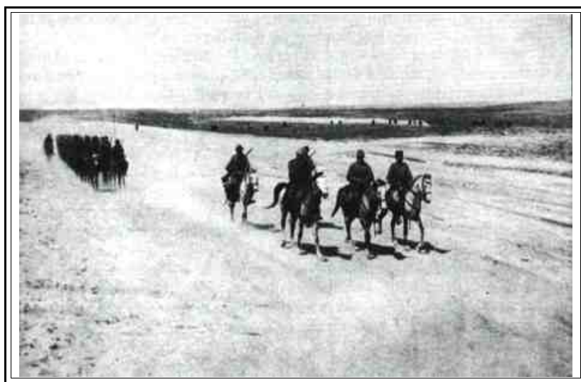
Cavalleria turca. Sinai 1916.

Il 10 aprile 1917, l'ambasciatore italiano a Londra, marchese Imperiali, comunicò al Governo italiano la richiesta da parte inglese di un contingente militare dotato di propria cavalleria e artiglieria (appoggiato da una forza aerea autonoma composta da almeno 12 apparecchi) da affiancare nel Sinai all'armata britannica agli ordini del generale Archibald Murray. Il Comando inglese, bene impressionato dalle prestazioni fornite dall'esercito italiano sul fronte veneto-friulano e su quello trentino, avrebbe "gradito in prima istanza l'invio di almeno un battaglione" da impiegare nella copertura di un tratto di fronte, in modo da liberare una divisione inglese che Murray avrebbe desiderato utilizzare per l'imminente, duplice offensiva finale su Bersheeba e Gaza: punti chiave dello schieramento difensivo austro-turco-tedesco approntato da tempo dal generale Otto Liman von Sanders, primo consigliere militare tedesco di Kemal Pasha.